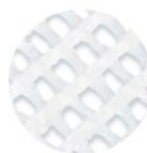
Den finmaskede netstruktur i Atrauman.