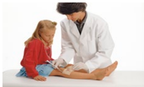
Atrauman applikeres på en hudafskrabning.

Produktet er klassificeret som et medicinteknisk produkt, klasse IIb, steril. CE-mærket ifølge EU-direktiv 93/42/EEC.